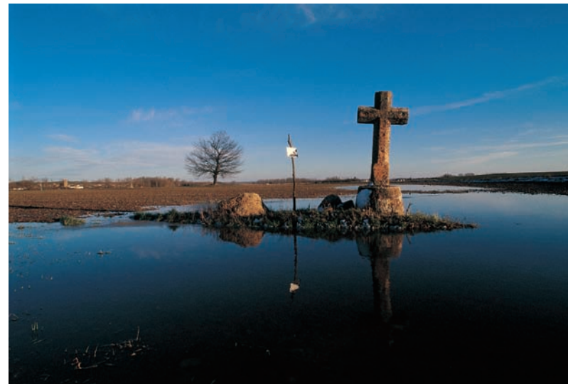
Villalcázar de Sirga (Palencia)

En el pueblo hay todos los servicios que un peregrino puede necesitar. En la pastelería Yadira tiene panadería, confitería y cafetería. Hay un taller en el que arreglan bicicletas, en la calle Las Cercas. ☎ 979 880 340. En la Casa de Cultura y en el ayuntamiento tienen conexión a Internet. Hay un centro de salud, en la plaza Conde Garay (☎ 979 880 245).