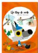
Un llop de conte #amistat #família #valentia