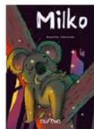
Milko Un heroi afamat